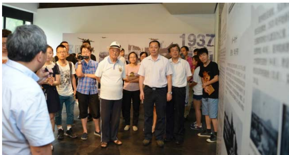
学校举办“抗日战争中的同济大学”展览

继续加强档案馆、校史馆、图书馆建设，为师生提供更好的文化服务。大力改善场馆硬件，开展档案数字化、校史编研和专题展览等工作。2014年制定《同济大学档案馆收集档案范围细则和工作方案》，学校每年举行档案馆日宣传活动，介绍档案法律法规和档案馆的各项业务，推出“同济大学档案馆微信公众号”和记忆同济历史的系列明信片。