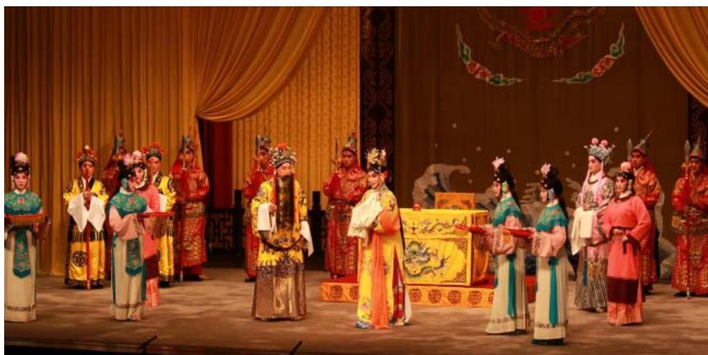
“梅韵麒风——上海师生纪念梅兰芳、周信芳诞辰 120 周年”专场演出

学校重视中华优秀传统文化的弘扬与传播，进一步加强“闻学堂”“大学生戏曲艺术实践基地”等传承创新平台建设，并着力建设“同济复兴古典书院”，构建多元化立体平台传承弘扬中华优秀传统文化。“闻学堂”开展书画、篆刻、戏曲欣赏、古典阅读等，举办系列展览，邀请名家名角讲座，举办“论语大会”，培养大学生接受传统文化的熏陶，提高艺术、美学、人文素养。“构建闻学堂平台，传承弘扬中华优秀传统文化”项目、“研读经典 修德笃行——同济大学‘复兴古典书院’建设”项目获评第一、二届全国高校“礼敬中华优秀传统文化”特色展示项目。