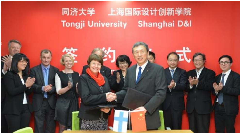
签约共建“上海国际设计创新学院”

2015 年，与芬兰阿尔托大学签约共建“上海国际设计创新学院”，项目通过上海市教委和教育部组织的专家评审。学校与佛罗伦市政府签订全面战略合作备忘录。两年来，新签/续签交流合作和双学位培养等协议 168 份，新增全英文硕士、博士培养学科/专业各 2 个，召开国际会议 89 次。