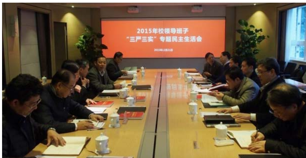
校领导班子专题民主生活会召开

格局。实施基层党组织向校党委述职述廉制度，对基层党组织落实“两个责任”进行检查督导，强化管党治党意识，确保党建工作目标任务落实、提升基层党建工作整体水平。强化基础保障，加大投入力度，加强平台建设，健全党建工作支撑保障体系。完成 2014 年专题民主生活会整改任务，巩固和拓展党的群众路线教育实践活动成果，推动反“四风”向深度和广度延伸。