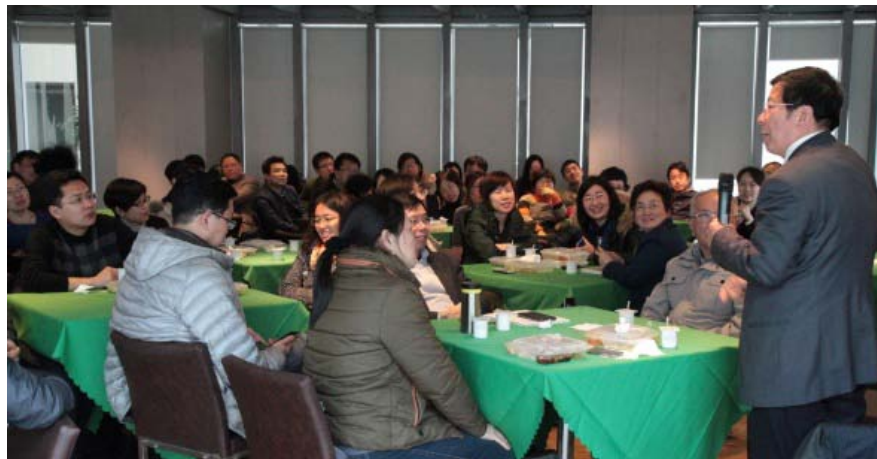
教师沙龙探讨“如何有效激发学生的主动思考能力”

四个平台建设的核心内容，采用专项培训、讲座、论坛、沙龙、报告会、教学竞赛、学院开放