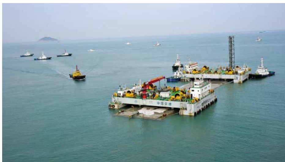
同济团队研发“沉管隧道接头张开位移量控制技术”应用港珠澳大桥

积极为重大工程提供科技支撑服务。在上海中心建设中，同济大学承担了设计转化、施工指导、技术支撑等工作，承担了大小60多个攻关课题，为工程建设“排忧解难”。仅节能措施就应用43项技术，将上海中心打造成一个绿色节能示范建筑。在上海迪斯尼乐园建设过程中，同济大学依托相关学科优势，发挥了多方面的积极作用。在港珠澳大桥建设中，同济技术为设计施工提供技术支撑，