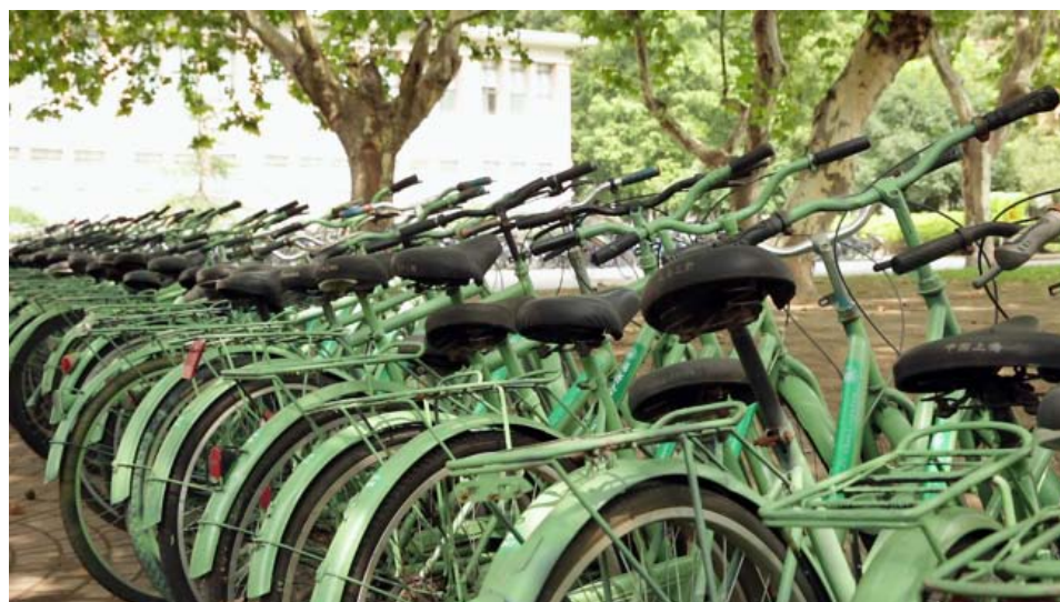
学校推出 200 辆校园公益自行车

为同济文 化的深厚积淀和传承基因。开设“可持续发展与未来”全校选修课，全面开展“绿色同济，青春同行”以及“绿色嘉园我先行”系列活动，支持“绿色之路协会”等学生社团活动；推出“同济大学绿色校园建设展览”，建设《同济大学绿色校