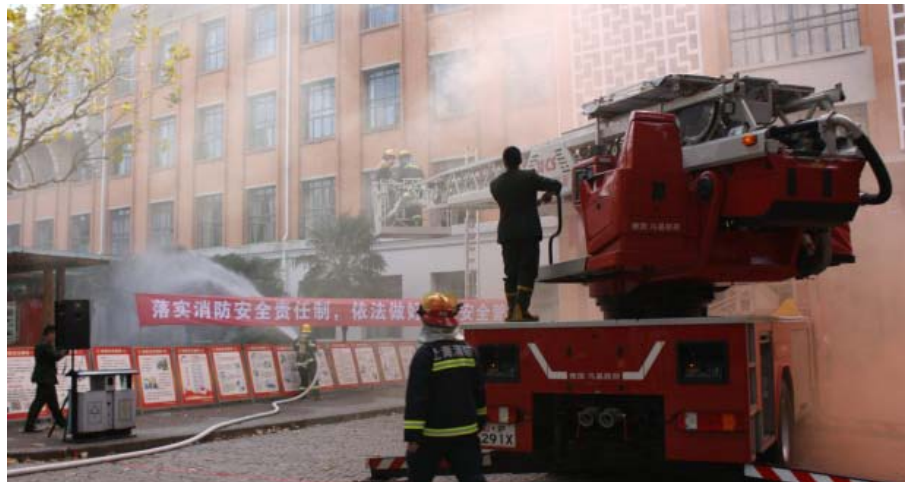
学校开展消防演习

构建三个防范平台。一是校园公共安全防范平台。定期召开联席会议，注重人防、技防和物防结合，强化校园实时监控和网格化巡逻联动机制，严格门卫管理制度。二是学校外来人口管理平台。从源头上加强外来人员的信息采集、建立管理信息系统、办理校园临时出入证、跟踪管理等工作。三是学校治安综合治理平台。各单位领导作为本单位治安