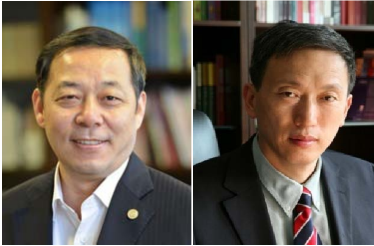
同济大学党委书记 杨贤金 同济大学校长 裴钢

2014、2015年，我们欣历盛世，见证辉煌。党的十八届四中、五中全会胜利召开，“十三五”国民经济和社会发展规划纲要制定，给了国人更多的期许，振奋人心。