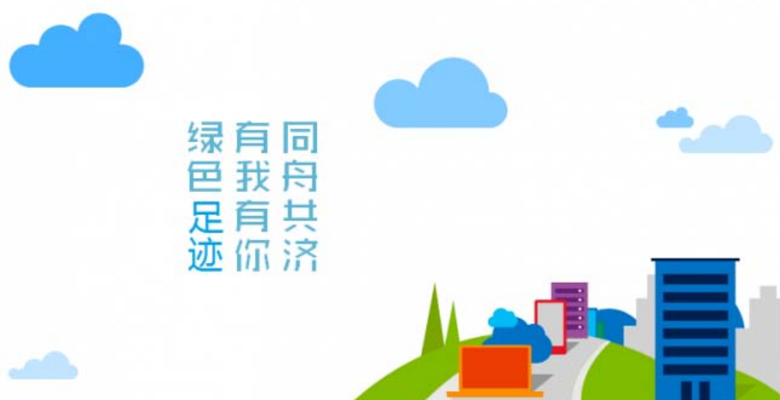
同济学子开展“舌尖上的水足迹”绿色校园实践

依托第二课堂和学生社团组织，不断推广可持续发展文化，使节约、绿色、环保的理念深入人心；学校建立了绿色校园示范点，规划《同济大学文化之旅——绿色之路》引导师生通过节能项目参观，从而进一步树立环保节约意识；提倡绿色出行，2014 年学校提供 200 辆公益自行车；支持学生开展相关研究和实践，例如学生团队开展了“公共自行车信息化管理技术与开发”创新创业课题。开展“绿色同济 青春同行”主题活动，2015 年共计开展活动 500 多场次，累计吸引了约 5 万人次的积极参与。开展“2015 年‘绿色同济’十佳项目”评选活动。