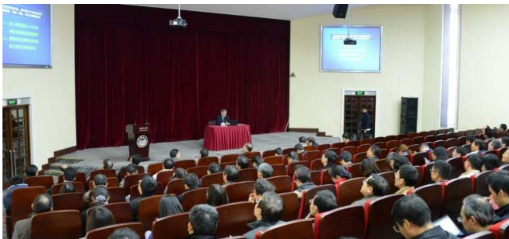
国家教育发展研究中心主任、国家教育咨询委员会秘书长张力教授来校做报告

了 53 个课题。有 3 个课题在教卫工作党委党建研究会的评选中获奖。依托“同济大学中国特色社会主义理论研究中心”，开展课题研究，进一步激发广大师生对中国特色社会主义理论学习和研究的热情。设立“马工程专项研究课题”，确立 7 项课题作为首批立项课题。编印《十八大十八问》，为理论学习提供指导。