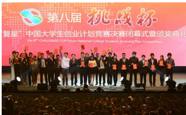
图 5. 第八届“挑战杯”中国大学生创业计划竞赛闭幕式

示范园区之一。同济承办第八届“挑战杯”中国大学生创业计划竞赛（见图 5），全面宣传展示学校发展建设成果与创新创业教育典型经验，获 2 金奖、1 银奖、2 个单项奖，总成绩并列全国第一。