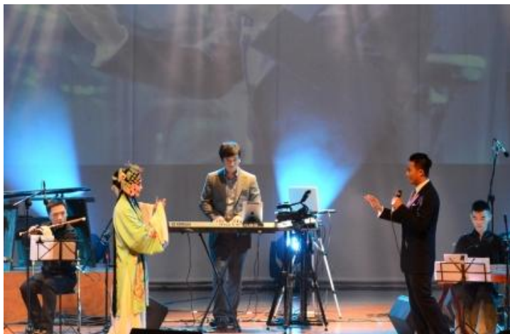
图 3. 张军“水磨新调 Kunplug”新昆曲音乐演唱会在同济大学上演

专场演出、何等杰《中华松魂》主题画展、“走近印度”系列文化展览、上海沪剧院折子戏专场演出、上海歌剧院经典歌剧《卡门》专场演出、上海话剧艺术中心话剧专场演出、上海民族乐团《响趣》打击乐专场演出、沪苏锡常宁五市评弹汇演、“乘着歌