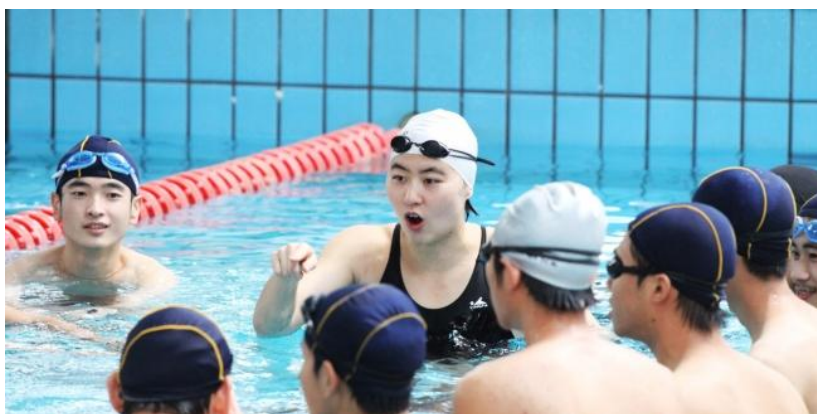
图 6. 奥运冠军焦刘洋为正在上游泳课的同济学子进行动作示范

学校高度重视大学生体育工作，不断完善课程设计和体育活动软硬件设施，促进体育社团健康发展。学校贯彻“以人为本，健康第一，全面发展，终身受益”的体育教育理念，全面实施大学生体质健康标准，共开设了 30 余门体育必修课、选修课和体育保健课。其中攀岩、生存技巧训练、游泳、龙舟、高尔夫和定向越野 5 门课程是为适应经济社会发展需要和学生体质健康锻炼需求而开设的休闲体育选修课程。学校共建立了 31 个单项体育协会，各单项协会在体育教学部专职教师的指导下，开设体育专项讲座，每周固定时间进行训练和比赛活动。学校鼓励学生走向操场、走进大自然、走到阳光下，有计划、有目的、有规律地指导学生开展体育锻炼，形成学生体育锻炼的热潮，努力改善学生身体形态和机能，达到体质健康标准，努力做到天天有活动，班班有比赛，院院有队伍的良好体育氛围创造条件。11 月 30 日，我校第二届体育社团嘉年华活动拉开帷幕，冠军面对面指导、社团风采展示、冠军沙龙、优秀运动员表彰等活动精彩纷呈。2012 年伦敦奥运会女子 200 米蝶泳冠军焦刘洋以及第 9 届全国大学生运动会中我校运动员代表朱琳、谢文骏、唐奕、陆滢等应邀参加活动，与到场同学友好互动。（见图 6）。奥运冠军焦刘洋、国家游泳队季丽萍、施扬、唐奕等进入泳池内为正在上游泳课的同济学子进行动作示范，手把手对同学们进行动作指导。