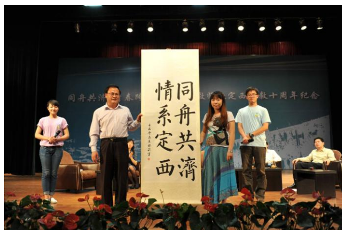
图 9. 同济大学举办“同舟共济 青春跨越——辅导员定西支教十周年”系列纪念活动

自 2001 年起,我校加入团中央组织的研究生西部支教计划,每年选派 4 名研究生赴云南元谋开展为期一年的支教活动。2006 年起,同时选派 4 名研究生赴四川宜宾开展为期一年的支教活动。