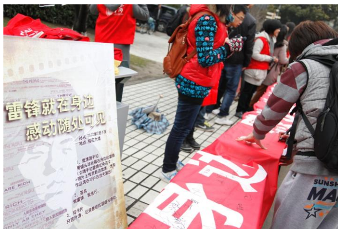
图 10. 学雷锋活动日，同济学子签名承诺“快乐学雷锋，随手做公益”

征集形式，结合时下流行的“快闪”、“微博”等时尚元素，寻找身边的“雷锋”，挖掘典型人物、先进事迹，并以之为榜样，将“雷锋精神”的传递给每一名同学。广大同济青年，在新的时代背景下，从身边做起，从小事做起，从点滴时间做起，“快乐学雷锋，随手做公益”（见图