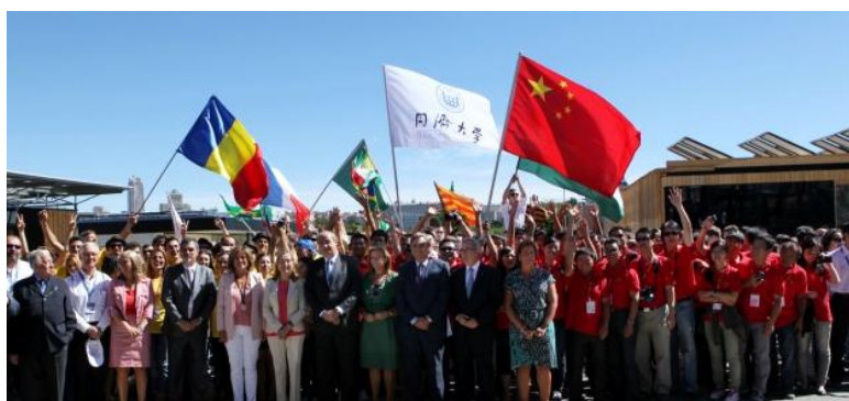
图 11. 同济学生搭建的“复合外皮生态住宅”出征 2012 欧洲太阳能十项全能竞赛

（见图 11），受到广泛关注，获得 2 个单项第三名。42 国 400 名学子相聚同济，参加“2012 国际学生环境与可持续发展大会”，共同探讨绿色经济。