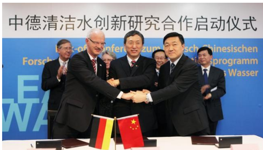
图 7. 中德清洁水创新研究合作项目在同济大学启动

逢甲大学名誉博士学位，并获得柏林工大金质奖章。副校长伍江连任全球可持续发展大学联盟理事会主席。