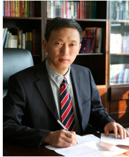
同济大学校长 裴钢

党的十八大报告强调，教育是民族振兴和社会进步的基石，把“努力办好人民满意的教育”作为加强社会建设的首要任务，对教育提出了新部署、新要求和新任务，体现了党中央对教育事业的高度重视和优先发展教育的坚定决心，为我们指明了全面推进教育事业科学发展的根本方向。