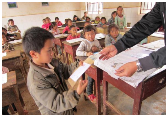
图 8. 同济大学爱心助学活动资助云南文山的贫困儿童

在一般面向社会的慈善活动中，由校工会和校团委分别统筹师生的慈善捐助。校工会不定期开展捐款、捐衣物等。校团委连续多年开展“携手，许你一个明天”爱心助学活动，资助了西部地区150名中小学生在继续