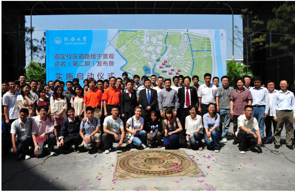
图 2. 嘉定校区道路楼宇景观命名第二期发布暨“仰望星空”地标揭幕

学校重视文脉的梳理和同济精神的传承弘扬。2012 年制作完成了《同济名片》，其中包括同济大学画册（2012 版）以及长度分别为 1 分钟、6 分钟、15 分钟等三个不同版本的学校形象片、校况片的制作，受到了师生和校外有关人士的高度评价。精心组织开展建校 105 周年暨工科创设 100 周年相关活动，设置了“仰望星空——校园文化”主题日、“协同创新——科学研究”主题日、“追求卓越——人才培养”主题日、“同舟共济——校友活动”主题日和“海纳百川——国际合作”主题日，开展了包括“百年卓越工程——纪念同济大学工科创设 100 周年”图片展暨《百年卓越工程教育》图书首发式、校庆主题晚会、“历史上的校庆”图片展、“文化传承创新：大学第四功能的内涵与实践”论坛、工科奠基人贝伦子塑像揭幕、学生社团嘉年华等活动，体现了同济大学的深厚文化底蕴。