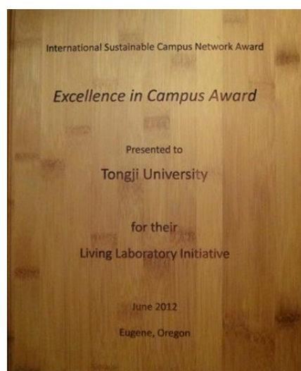
图 12. 同济大学荣获“全球可持续校园杰出奖”

经过努力，同济“可持续发展大学”建设取得重大成效。2011年6月，由同济大学、天津大学、浙江大学、香港理工大学等8所高校和中国建筑设计研究院、深圳建筑科学研究院共同发起组成的“中国绿色大学联盟”正式成立，我校常务副校长陈小龙教授担任主席。2011年11月，同济与法国生态、可持续发展部签署了关于培养可持续发展工程师项目合作意向书。2012年5月，同济与意大利环境部签署《关于建立中意可持续发展中心的框架协议》。2012年，联合国环境规划署成立了全球环境与可持续发展大学合作联盟，已经有120多个国家的大学参加，我校副校长伍江教授担任理事会主席。2012年6月5日“世界环境日”当天，由同济大学、联合国环境规划署联合主办的“2012国际学生环境与可持续发展大会”开幕，来自全球42个国家近400名青年大学生与会。2012年6月，同济参加Rio+20联合国峰会，校长裴钢介绍同济经验。2012年6月，在美国俄勒冈大学举行的“国际可持续校园联盟”大会上，同济大学被授予2012年“全球可持续校园杰出奖”（见