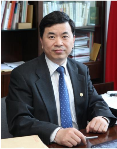
同济大学党委书记 周祖翼