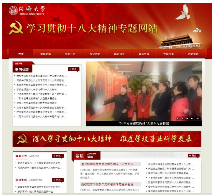
图 1. 同济大学学习贯彻十八大精神专题网站

学校广泛开展专题宣传活动。学校遴选部分校内相关学科的专家教授组成“同济大学学习贯彻党的十八大精神宣讲团”，方便各基层单位在组织开展相关学习活动时根据需要邀请专家上门作专题辅导报告。我校十八大代表、校党委主要领导多次通过报告会、座谈会等形式，向学生、青年教师、高层次人才、老干部等群体宣讲十八大精神。12月12日，由中共上海市委宣传部、上海市教育工作党委、新华社上海分社主办，同济大学等10所高校承办的“科学发展 成就辉煌——宣传贯彻十八大精神大型图片展”高校巡展首展在我校开幕。展览展示了过去5年和10年党和国家取得的新的历史性成就，宣传党的十八大精神，宣传在学习贯彻党的十八大精神方面涌现的先进人物和先进事迹。为营造学习贯彻党的十八大精神的良好舆论氛围，学校以《同济报》、校园网、广播台等校内新闻媒体为载体，积极开辟专栏，并建立学习宣传贯彻党的十八大精神专题网站（见图1），广泛深入报道师生学习贯彻党的十八大精神有关情况，不断刊发校内专家学者对党的十八大精神的有关解读。学校充分发挥新媒体的作用，借助同济微博等平台广泛宣传学校学习贯彻党的十八大精神的相关活动。